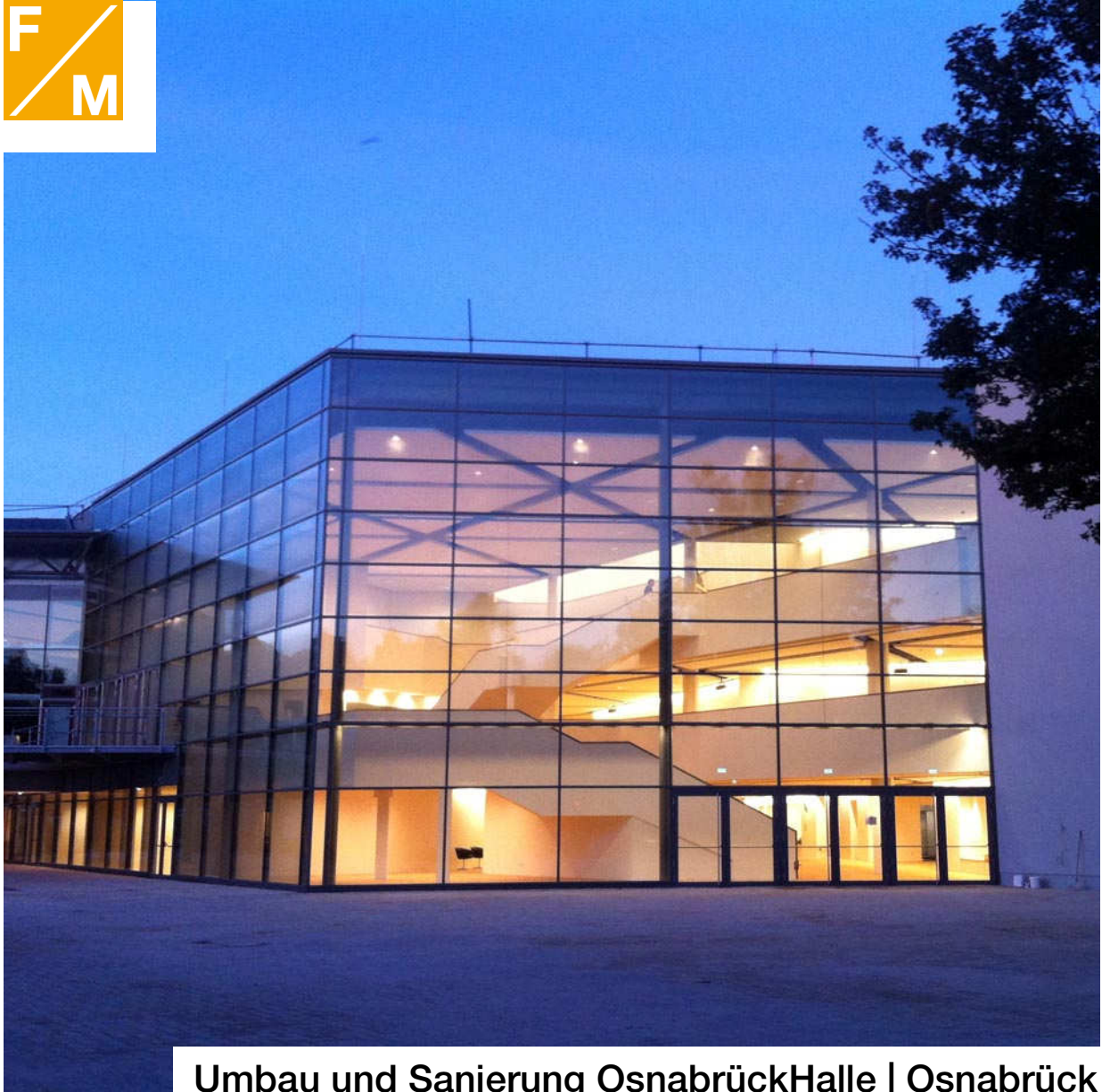
Umbau und Sanierung OsnabrückHalle | Osnabrück