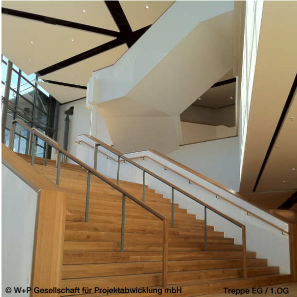
© W+P Gesellschaft für Projektentwicklung mbH