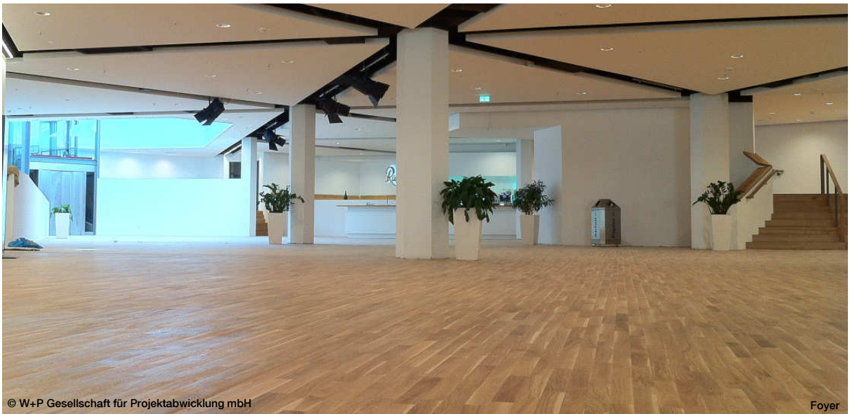
© W+P Gesellschaft für Projektentwicklung mbH